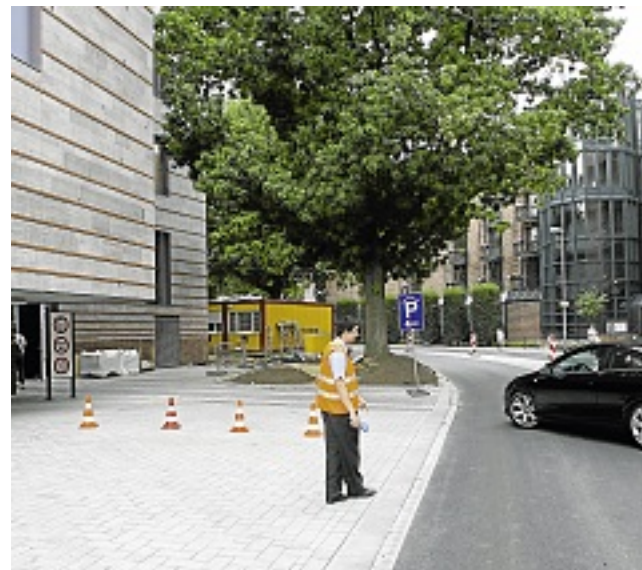
Durch den Überstand des Gebäudes wirkt die Zufahrt zur Tiefgarage auf der Stubengasse sehr niedrig.

Irmgard Brocks jedenfalls ist beruhigt. „Das passt schon“, meint die Steinfurterin, die es gewohnt ist, vor den Tiefgaragen auszusteigen, um Maß zu nehmen.