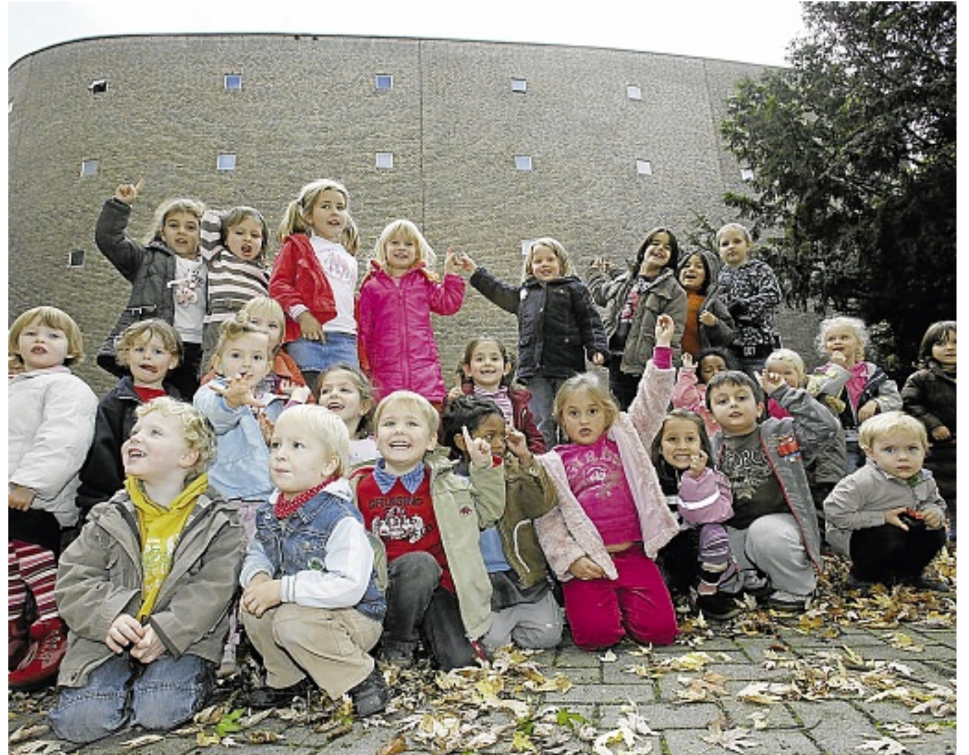
In der Kirche St. Sebastian soll ein Kindergarten auf zwei Ebenen entstehen. Damit ist der Abriss der zur Disposition stehenden Kirche endgültig vom Tisch. Nicht nur die Kinder freut's.